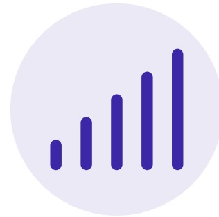
Automatische Auswertung der Daten

Die Integration der Sensoren in bestehende Druckluftanlagen ermöglicht die Überwachung der Druckluftqualität in Echtzeit und die automatische Auswertung der Daten.