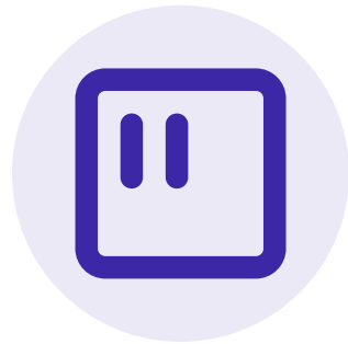
Integration der Sensoren in bestehende Druckluftanlagen

Die Miniaturisierung der Sensoren ermöglicht die Integration von Sensoren in bestehende Druckluftanlagen, was zu einer Reduzierung der Kosten und einer Erhöhung der Zuverlässigkeit führt.