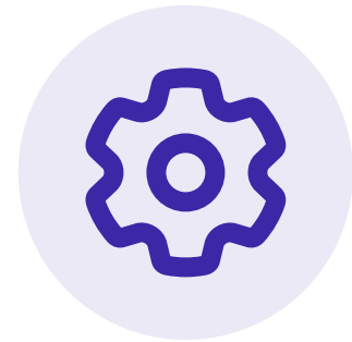
Optimierung der Druckluftanlagen durch KI und maschinelles Lernen

Die automatische Auswertung der Daten ermöglicht die Identifizierung von Trends und die Vorhersage von Problemen, bevor sie zu Ausfällen führen.